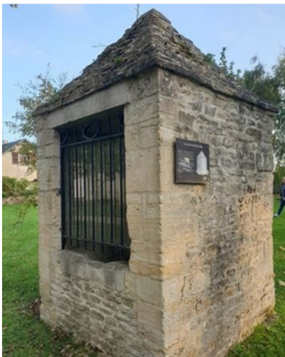
Puits de la mairie